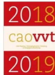
Verpleeg-, Verzorgingshuizen en Thuiszorg VVT