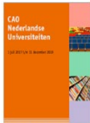
Nederlandse Universiteiten (NU)