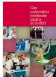
Universitair Medische Centra (UMC)