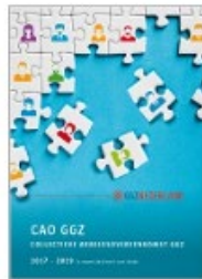
Geestelijke Gezondheidszorg (GGZ)