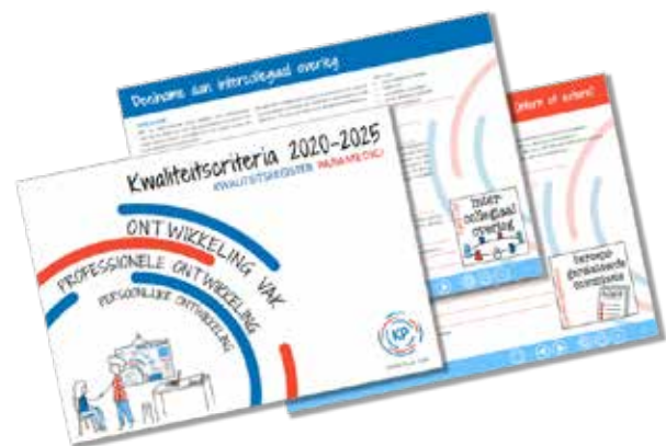
Figuur 1. Nieuwe vormgeving voor de interactieve pdf van de criteria 2020-2025

Naast de inhoudelijke aanpassingen zijn ook de formuleringen en de vormgeving veranderd en komt er een interactieve pdf met de criteria en toelichtingen. Dit vergroot de leesbaarheid van het document en vindbaarheid van activiteiten.